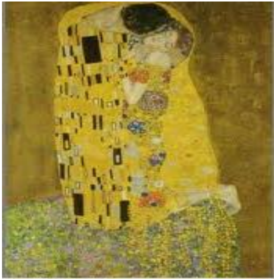
《吻 Der Kuss》, 克林姆, 1907-1908, 油畫

克林姆的作品喜愛使用大量的金色材質。此幅畫克林姆運用不同圖形及色彩來表達，欣賞完這幅畫，你有何感受？你認為男女主角之間發生了甚麼樣的故事？