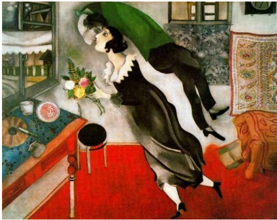
《生日 The Birthday》，夏卡爾，1915， 油畫